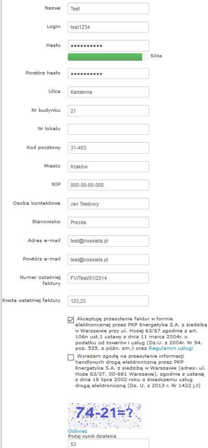
Rys. 3 Formularz rejestracyjny dla jednoosobowej działalności gospodarczej