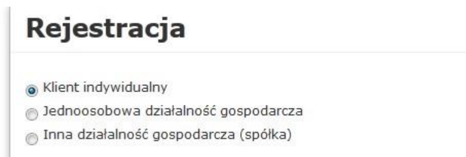
Rys. 1 Wybór rodzaju klienta

W pierwszych dwóch przypadkach, po prawidłowym wypełnieniu formularza tworzone jest konto portalowe. Trzeci przypadek jest zgłoszeniem. Dane z formularza są wysyłane bezpośrednio do PGE Energetyka Kolejowa S.A.. Konto portalowe jest zakładane dopiero po pisemnym zawarciu umowy na wystawianie, udostępnienie i archiwizację faktur w formie elektronicznej pomiędzy klientem a PGE Energetyka Kolejowa S.A..